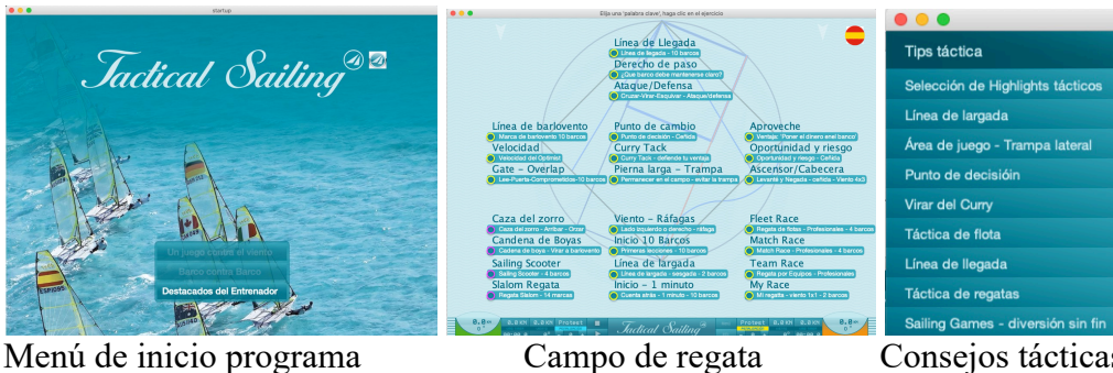
Menú de inicio programa