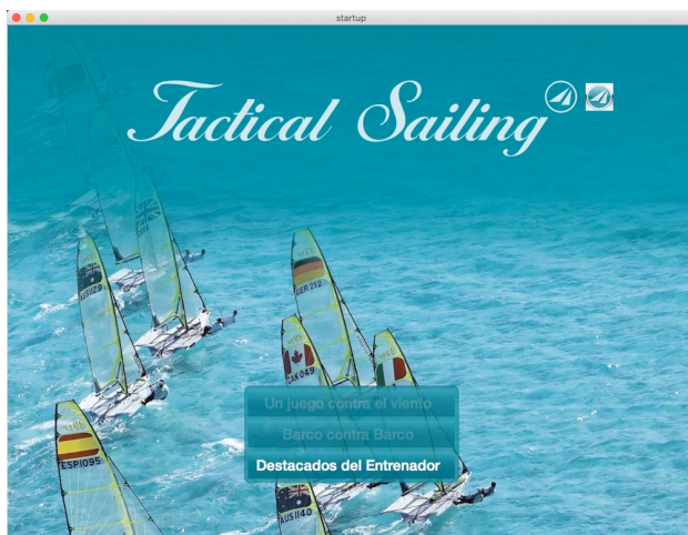
Destacados del entrenador

"Herramientas del entrenador" se ha convertido a lo largo de los años en un popular "programa de enseñanza y aprendizaje" para principiantes en navegación, navegantes de regatas y expertos en estrategia y táctica. Hemos logrado desarrollar más de 100 módulos de aprendizaje y sintetizarlos en las "Herramientas del entrenador" to resumir.